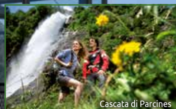
Cascata di Parcines

... accesso diretto all'Alta Via di Merano